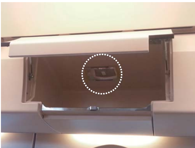
特急ラピート手荷物入れに設置された忘れ物防止ミラー