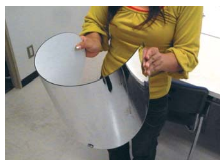
こんなに曲げても割れません