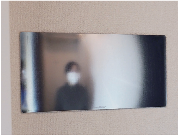
ぼかし加工を施した「FF ミラー気配」