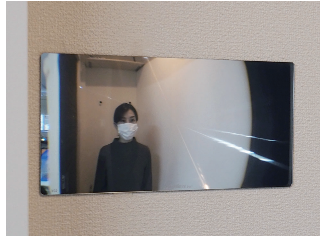
従来の FF ミラー